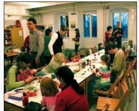
Puppentheater an Familiensontagen