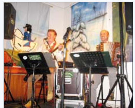
Die Pöhlbachmusikanten beim Erzgebirge-Hutzenabend