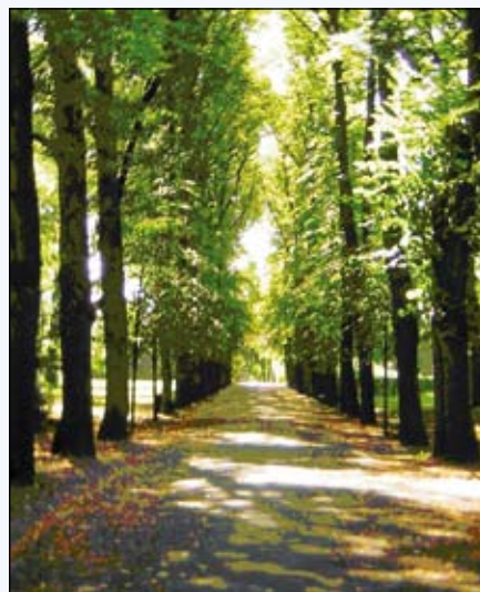
Die einladende Albert Brodersen-Allee

Es erwarten Sie Entspannung, Erlebnis oder beides!