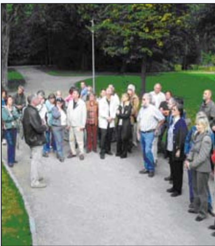
Bei einer der beliebten Parkführungen

Auch zu privaten Feiern wird gerne ins Schloss Biesdorf eingeladen – und die Schloss- und Parkführungen sind sowieso beliebt!