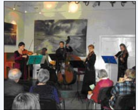
Musikanten spielen auf (Konzerte gibt es jeden ersten Sonntag im Monat)