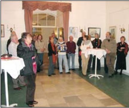
Eine Vernissage im Kaminzimmer

Auch zu privaten Feiern wird gerne ins Schloss Biesdorf eingeladen – und die Schloss- und Parkführungen sind sowieso beliebt!