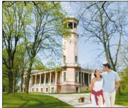
Schloss Biesdorf (nach der Renovierung)

und Kapitellen sowie dem 29 m hohen Turm als spätklassizistisches Bauwerk in italienischem Stil.