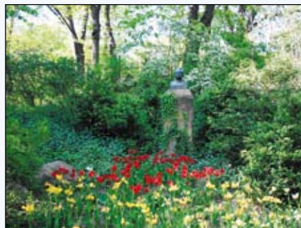
Die Büste Werner von Siemens im Park