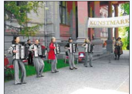
Gruppe TUTTI, Besuch aus Minsk (2008)

für das Siemens-Imperium) sind auch heute Kultur, Geselligkeit und geistiges Schaffen wieder Inhalt des Schlosslebens.