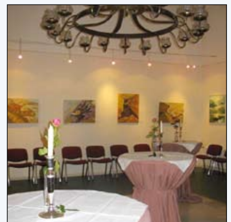
Blick in den Galerie-Saal

Unter Trägerschaft des BALL e.V. und Verantwortung des Bezirksamtes Marzahn-Hellersdorf ist hier das Stadtteilzentrum Biesdorf zu Hause und hat mit seinen Veranstaltungen und Angeboten seit 1994 schon fast eine halbe Millionen Besucher einbezogen. Ob die monatlichen Schlosskonzerte, die ständige Ausstellung zur Schlossgeschichte, Vernissagen, vielfältige künstlerische Aktivitäten, Kamingespräche, Lesungen oder Bürgerberatungen zum Bürgerhaus - sie machen das Schloss immer